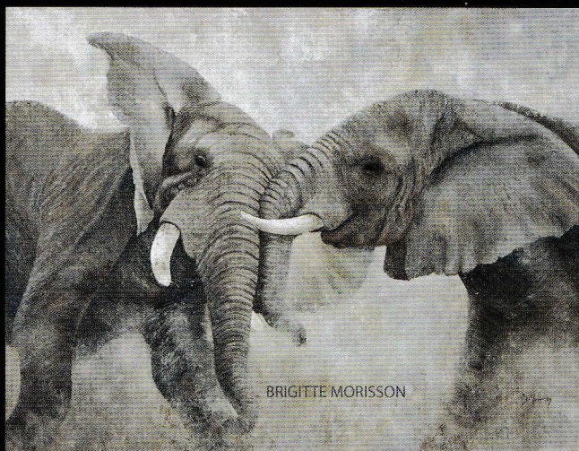
Two Giants, 89x116cm