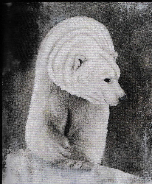
Ours blanc, 100x80cm